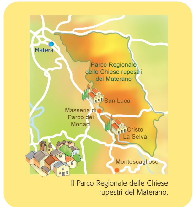
Il Parco Regionale delle Chiese rupestri del Materano.

Il monachesimo antico era caratterizzato da una vita in luoghi isolati, deserto o foresta, dove, secondo la regola di San Basilio fissata nel IV secolo d.C., il monaco eremita passava la vita in preghiera e penitenza. Solo con San Benedetto, nel VI secolo d.C., fu introdotto un nuovo modello di vita che prevedeva l'alternarsi della preghiera e del lavoro, all'interno di una piccola comunità. Nel Materano monaci basiliani e benedettini sono vissuti fianco a fianco trovando ciascuno il luogo adatto alle proprie esigenze.