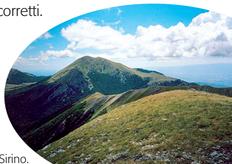
Il Monte Sirino.