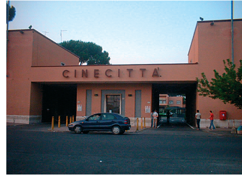
Uno degli ingressi di Cinecittà .

Negli anni cinquanta del Novecento anche molti registi americani venivano a Roma per realizzare le loro pellicole. Cinecittà fu chiamata la "Hollywood sul Tevere", dal nome della località americana dove si realizza ancora oggi la maggior parte dei film: Hollywood.