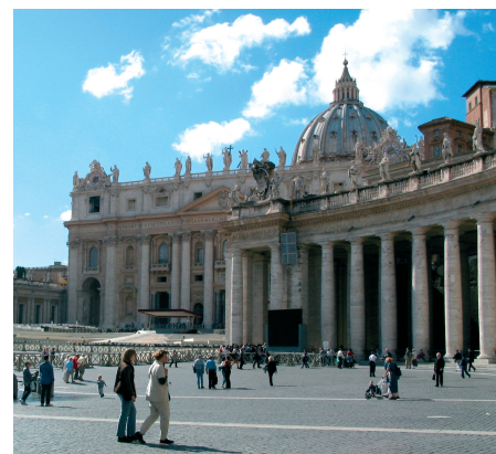
Piazza San Pietro.