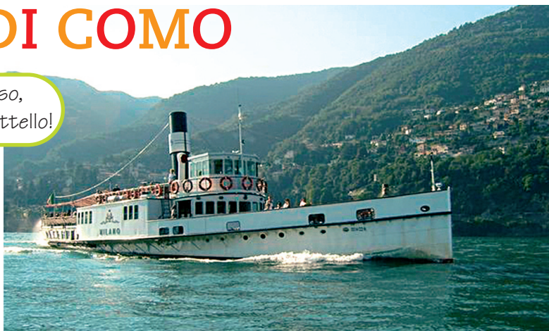
Uno dei battelli che effettuano la navigazione sul Lago di Como.

Individua sulla cartina le località che possono essere le tappe di una piccola crociera sul Lago di Como.