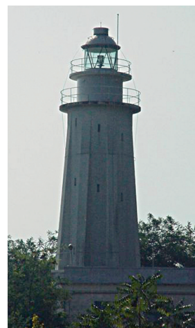
Il faro sul Monte Serrone .

Trascrivi nelle caselle le lettere colorate in ordine dall'alto in basso: leggerai il nome della località "misteriosa".