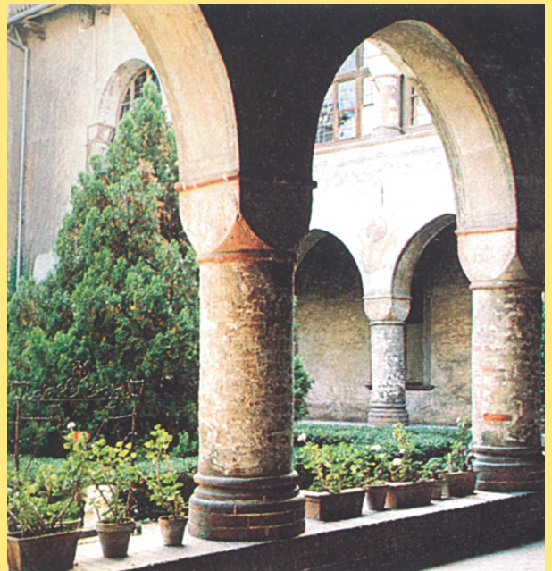
Cortile di Palazzo di Anna d'Alençon (XV secolo).

Osserva le fotografie dei due cortili e completa la tabella.