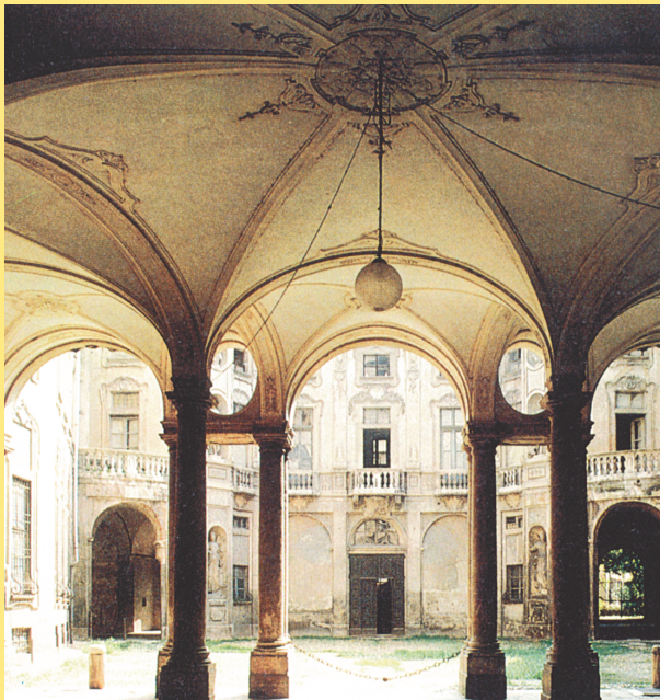
Cortile di Palazzo Gozzani Treville (XVIII secolo).