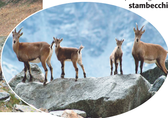
Alcuni esemplari di giovani stambecchi .