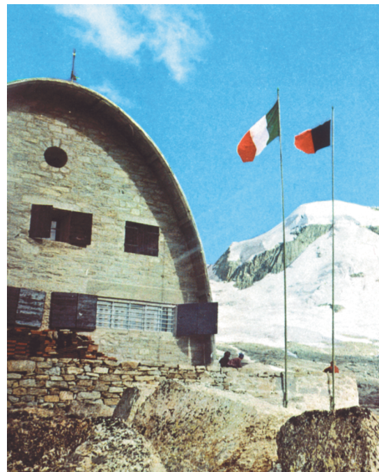
Il rifugio Vittorio Emanuele in cima al Gran Paradiso.

Colora in verde le valli piemontesi e in rosso quelle valdostane.