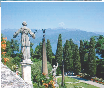
Il giardino del Palazzo Borromeo sull'Isola Bella.