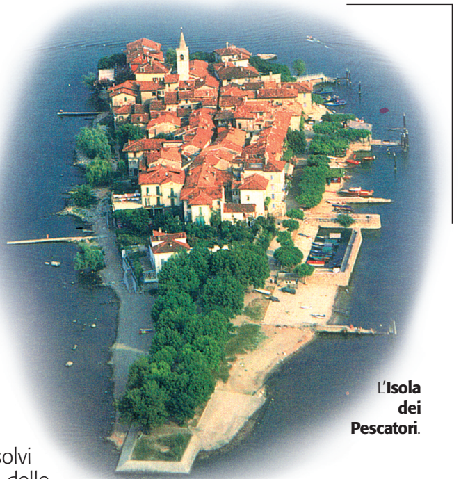
l'Isola dei Pescatori.