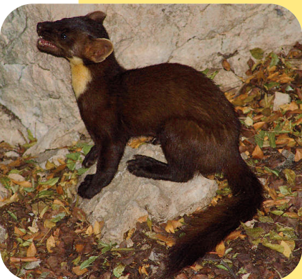
La martora .