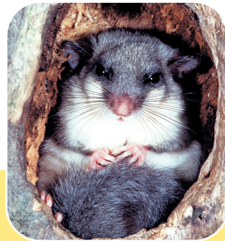
Il ghiro .

Come sai, la Barbagia è popolata da molti e rari animali selvatici : questi sono solo alcuni fra quelli che abitano i boschi.