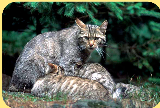
Il gatto selvatico .