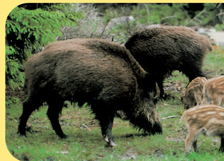
Il cinghiale .

Ma... qual è l'animale che più di tutti rappresenta la Sardegna? Per saperlo leggi la sua carta d'identità e completala aggiungendo il nome.