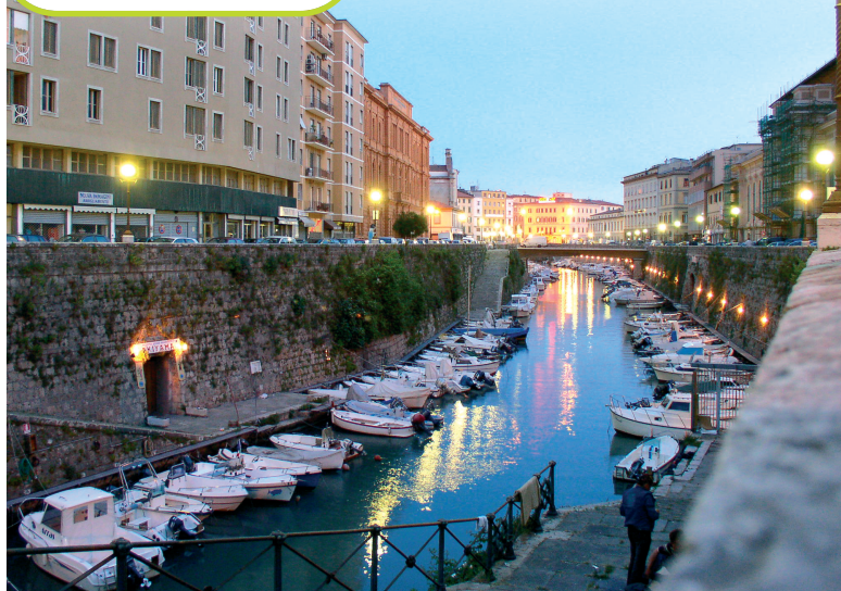
Il Fosso Reale a Livorno.

Colora solamente le caratteristiche che riguardano la città di Livorno.