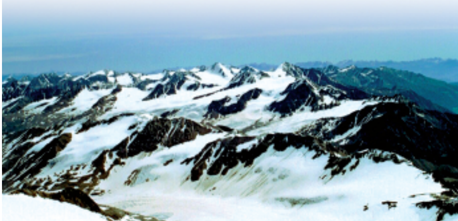
Il ghiacciaio del Similaun .