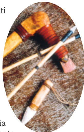
Gli utensili di Otzi.