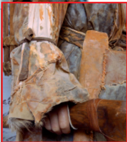
Riproduzione di Otzi con vestiti e utensili.