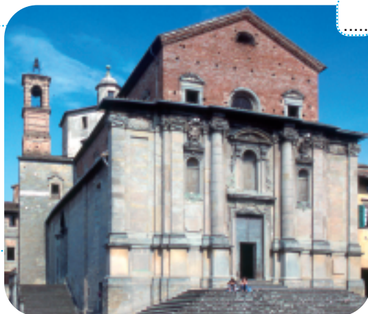
Il Duomo dedicato ai Santi Florido e Amanzio .