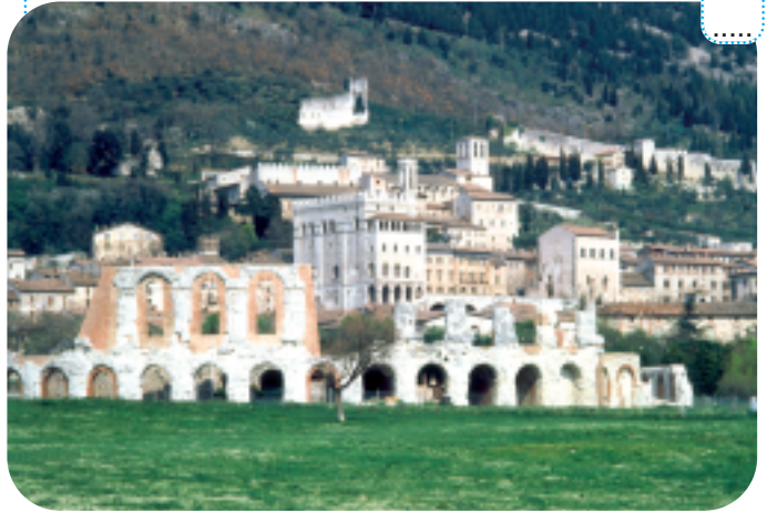
L' Anfiteatro romano ai piedi delle colline.

5 Sei un po' artista e ami la musica? Ti interessano gli strumenti musicali a corda? Vuoi conoscerne "da vicino" il suono, oppure vorresti imparare a costruirne uno? La Scuola per Maestri Liutai-Archettai ti aspetta!