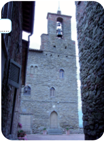
Il trecentesco Palazzo del Podestà .

4 In questa cittadina troverai un particolare tipo di lavorazione artigianale dei tessuti: il tulle. Concediti una visita al Museo del Tulle e ammirerai un'arte antica!