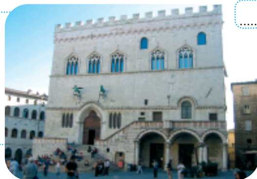
La facciata di Palazzo dei Priori .

1 Non perderti, nell'ex Chiesa di San Francesco, l'esposizione delle magnifiche tovaglie umbre e i preziosi arazzi a "fiamma" e a "occhio di pernice". Rimarrai a bocca aperta; si tratta di pezzi unici, alcuni impreziositi con fili d'argento, altri decorati col simbolo della città... lo ricordi?