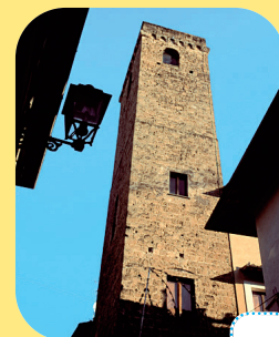
Torre Barbarossa. ....