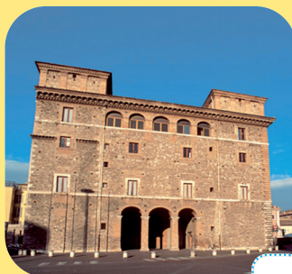
Palazzo Spada. ....