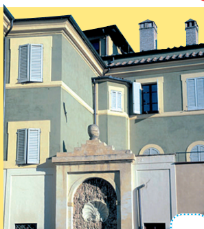
Palazzo Fabrizi. ....

Traccia ora sulla cartina, con un colore diverso, il percorso per raggiungere la Chiesa di San Francesco, partendo dall'Anfiteatro Romano senza passare da Via XI Febbraio, in modo da visitare gli edifici in fotografia. Numera le immagini dei tre palazzi, nell'ordine in cui li incontri.