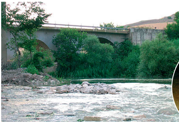
Un'ansa del fiume che... stai scoprendo.