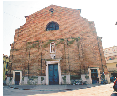
Facciata del Duomo di Rovigo.